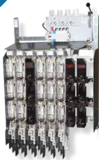
Tableau Urbain Réduit