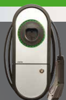
Ensto One Home

Superenkel och säker hemmaladdare. Det är den du behöver.