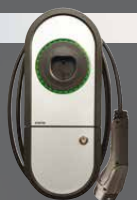
Ensto One Home

Superenkelt och säkert hemmaladdare. Det är den du behöver.